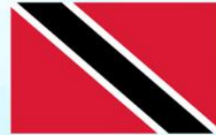
Trinidad and Tobago