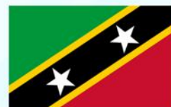
Saint Kitts and Nevis